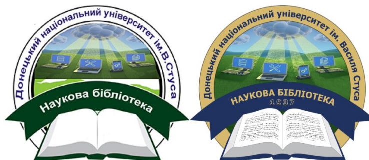
Рисунок 1 – Оновлений логотип бібліотеки (справа)

Наступним етапом є розробка макету дизайну сайту з урахуванням визначених вимог до зовнішнього вигляду і функціоналу. Здебільшого вся увага приділяється розробці саме дизайну головної сторінки, а далі відповідно до нього виконується оформлення внутрішніх сторінок. І, нарешті, після затвердження дизайну розпочинається етап безпосередньої розробки Front-End частини.