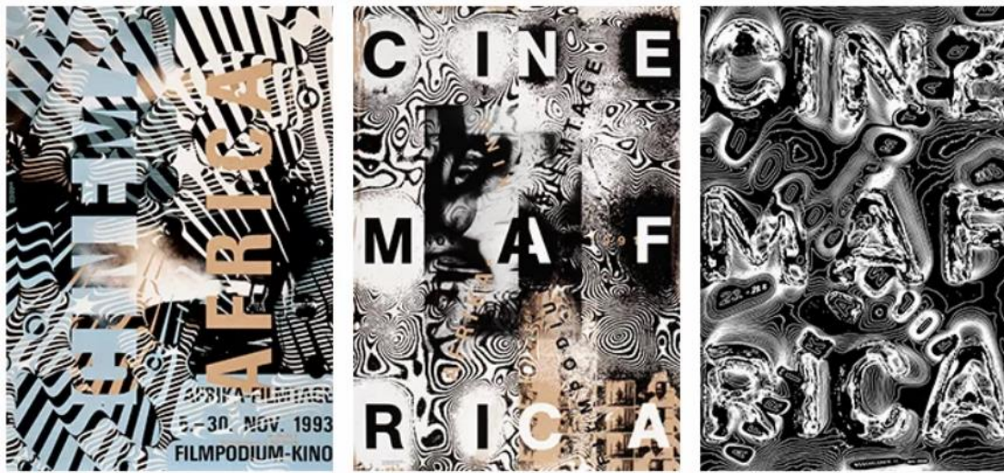
Рис. 2. Приклад швейцарського стилю у світі

Ніклаус Трокслер є ще одним видатним сучасним швейцарським дизайнером, який спеціалізується на розробці дизайн-концепцій для архітектурних проєктів та подій. Його роботи показані на рис. 2.